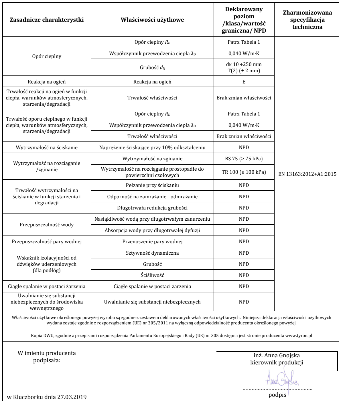
Tabela 2 Deklarowane Właściwości Użytkowe: